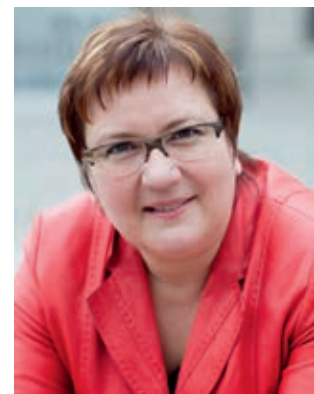
Parlamentarische Staatssekretärin und Beauftragte der Bundesregierung für die neuen Bundesländer, für Mittelstand und für Tourismus