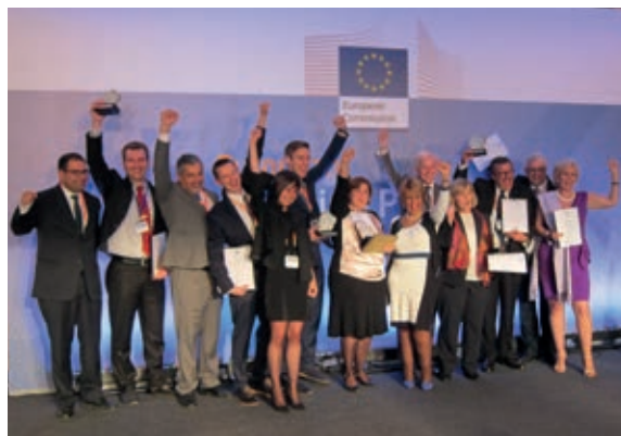
Preisverleihung 2014 in Neapel

Bei der Preisverleihung im Oktober 2014 in Neapel konnte sich die deutsche Initiative „Wiesbaden Engagiert!“ gegen die europäischen Mitbewerber in der Kategorie 6 durchsetzen und den ersten Preis gewinnen.