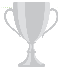
Gewinner des deutschen Vorentscheids des Europäischen Unternehmensförderpreises 2014

In der „BRENNEREI“ finden außerdem Innovationswerkstätten mit den Schwerpunkten Wissens- und Technologietransfer statt. Im Rahmen des EU-Projektes CCC reloaded: CREALAB, an dem die „BRENNEREI“ als Partner beteiligt ist, werden die Innovationswerkstätten europaweit durchgeführt.