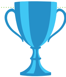
Gewinner des Europäischen Unternehmensförderpreises 2014 in der Kategorie 6

Die Landeshauptstadt Wiesbaden setzt ihre Strategie zur Stärkung des sozialen Verantwortungsbewusstseins von Unternehmen durch fünf Maßnahmen um: ein niedrigschwelliger Einstieg in soziales Engagement durch einen jährlich stattfindenden